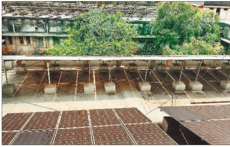
सिम्स में लगा सोलर सिस्टम कई साल से बंद।

पैनल जंग खा चुके हैं। पैनल पूरी तरह से ध्वस्त हो चुका है, वहीं बैटरी खराब है। ऐसे में सिम्स के मेल सर्जिकल वार्ड, आर्थोपेडिक वार्ड, फिमेल सर्जिकल वार्ड, बर्न यूनिट जैसे पुराने वार्डों में बिजली बंद होते ही अंधेरा छा जाता है, यह प्रबंधन की कहानी बन चुकी है। हालांकि सिम्स प्रबंधन ने सोलर को दुरुस्त करने का बीड़ा उठाया है लेकिन इसके में देरी हो रही है। सिम्स प्रबंधन का कहना है क्रेडा ने इसकी स्वीकृति के लिए रायपुर कार्यालय फाइल भेजी है, टेंडर लगने और वर्क आर्डर होने में ही दो माह का समय गुजर जाएगा। ऐसे में कहा जाता सकता है कि आने वाले दो महीने सिम्स के मरीजों को सोलर की बिजली मिलनी मुश्किल है।