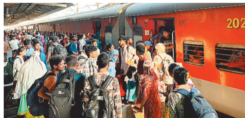
मंगलवार को बिलासपुर स्टेशन पर ट्रेन में पर रखने की जगह नहीं थी।

गर्मी की छुट्टियां शुरू होते ही बिलासपुर से लंबी दूरी की ट्रेनों में कंफर्म टिकट मिलना मुश्किल हो गया है। ज्यादातर ट्रेनों में मई तक सीटें फुल हैं और वेटिंग 100 से 150 के पार पहुंच चुकी है। तत्काल टिकट भी काउंटर खुलने के दो मिनट के भीतर खत्म हो रहा है। मुंबई, दिल्ली और वाराणसी जाने वाली अधिकांश ट्रेनों में मई तक अधिकांश ट्रेनों में 'नो रूम' की स्थिति बन गई है। तत्काल टिकट के लिए काउंटर से लेकर बाहर तक लंबी कतार लग रही है। यात्री सुबह से लाइन में लगकर काउंटर खुलने का इंतजार कर रहे हैं और जैसे ही टिकट विंडो खुल रही महज दो मिनट में ही टिकट खत्म हो जा रहा है। मंगलवार की सुबह भी ऐसा ही हुआ। इससे ज्यादातर यात्रियों को निराश होकर लौटना पड़ा।