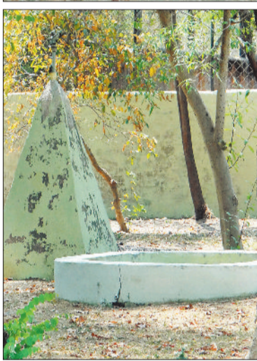
सूखे पड़े जलकुंड, प्यासे भटक रहे वन्य जीव।

दोपहर की तेज धूप में पानी छिड़काव के लिए बंद कर दिया गया है। इसके अलावा किसी भी केज में