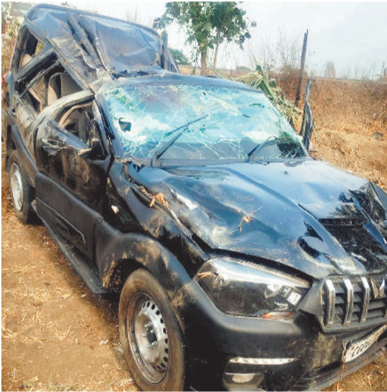
बिल्हा मुख्य मार्ग पर कुछ असामाजिक तत्वों ने वहां से गुजर रहे वाहनो पर पथरबाज किया।

बिलासा एयरपोर्ट से बोइंग विमान उड़ाने और एयरपोर्ट को विकसित करने की मांग को लेकर बिलासपुर एयरपोर्ट अथॉरिटी के केन्द्रीय मंत्री तोखन साहू से मुलाकात की। केन्द्रीय मंत्री को सौंपे गए हार्दिकता से सदस्यों ने कहा कि बिलासा एयरपोर्ट राज्य सरकार के आधीन है इससे विस्तार और आधुनिक सुविधाएं बढ़ाने में विलंबता और तत्कालीन समय तक सीधी उड़ान पूरी की जा सकती है। सदस्यों ने रेलवे कोविंग टर्मिनल विस्तार के बारे में भी केन्द्रीय मंत्री को हार्दिकता से सौंपा है।