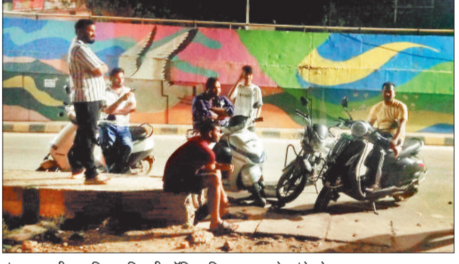
मंगलवार की रात तिफरा बिजली ऑफिस शिकायत करने पहुंचे लोग।

भरी गर्मी में बिजली बंद होने पर उपभोक्ताओं का गुस्सा उबाल मारने लगा है। पश्चिमी डिवीजन के अंतर्गत कुदुदंड में बीती रात 10 बजे जम्पर कट गया, जिसके चलते रात भर बिजली बंद रही। बताया जा रहा है कि फ्यूज काल की टीम सुबह मौके पर पहुंची लेकिन बिजली के लो वोल्टेज, जम्पर कटने, ट्रांसफार्मर खराब होने जैसी घटनाएं हो रही हैं। सोमवार की रात 10 बजे कुदुदंड, सरकारी कुंआ, मिट्टी तेल गली जैसे