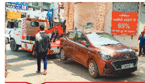
सिम्स के अंदर बीच में कार पार्किंग करने पर ट्रैफिक पुलिस फ्रेन से ले जाते हुए।

बिल्हा | मस्तूरी | तखतपुर | मुंगेली | कोटा | लोरमी | सरगांव | पेंड़ा | बेलतरा | रतनपुर | पथरिया